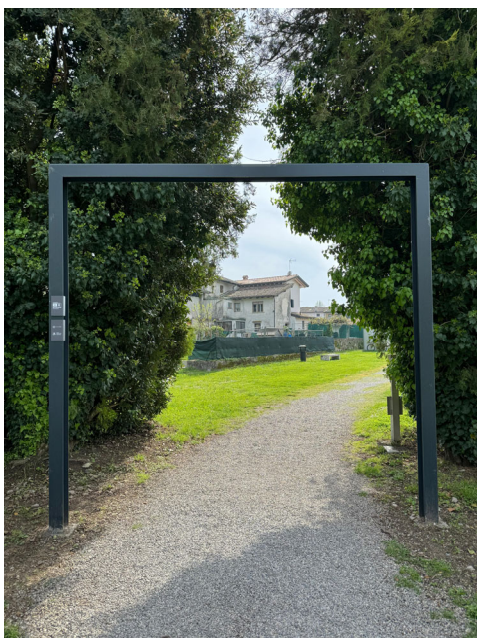
Area del Fondo Cossar