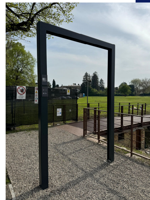
Fondo CAL-case romane