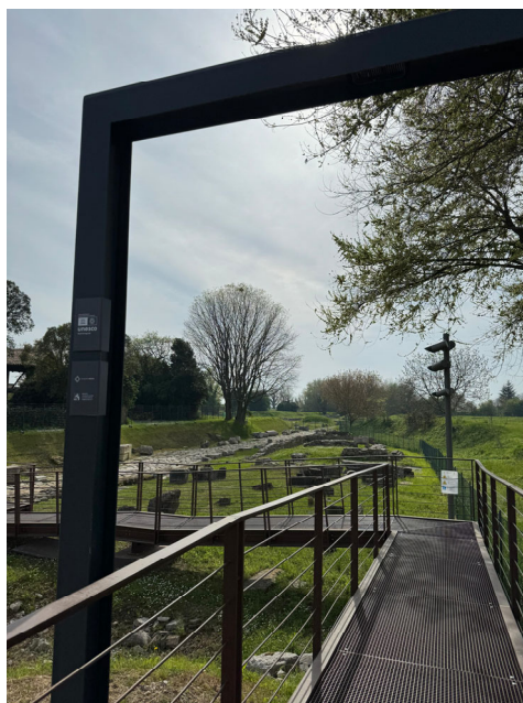
Decumano di Aratria Galla