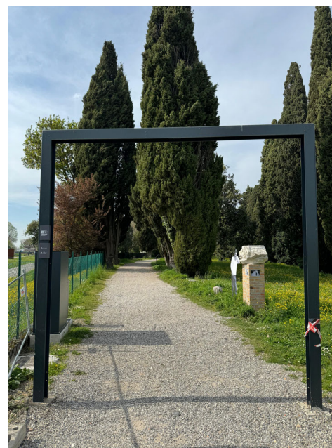
Antico porto fluviale